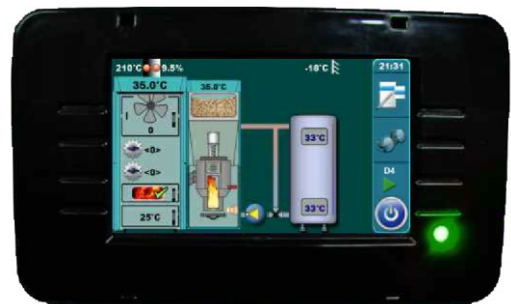
Touchscreenregelung mit Farbdisplay