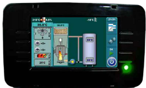
Touchscreenregelung mit Farbdisplay